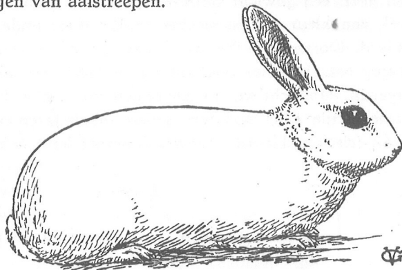
Witte van Hotot,

Onder de zware fouten vinden wij o.a. oog-omzooming breeder dan 5 millimeter.