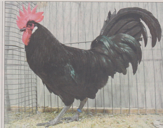
Catégorie des coqs légers et nerveux: Le coq de race Bresse-Gauloise.